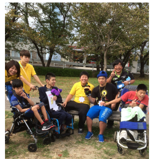
オリエンテーリング大会 より

「3人の中で甘いおにぎりを食べているのは誰？」等のお題をクリアして、無事に 宝箱を見付けることができました。お題をクリアする達成感があつたり、みんなで 相談して答えを決めてチームワークがうまれたりと充実したオリエンテーリング大会になりました。