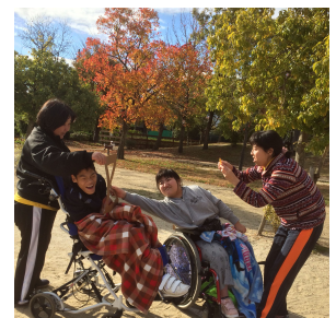
「額縁写真を撮ろう」より

「秋っぽいものを見つけて額縁写真を撮ろう」と考えていましたが、子どもたちは自分が額縁の中に入って写真を撮りあいっこです。写真を撮っている子を横から撮ってまるでトリックアートのような取り組みになりました。